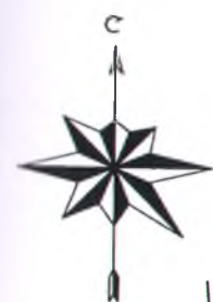
Схема планировочной организации земельного участка, М 1:500