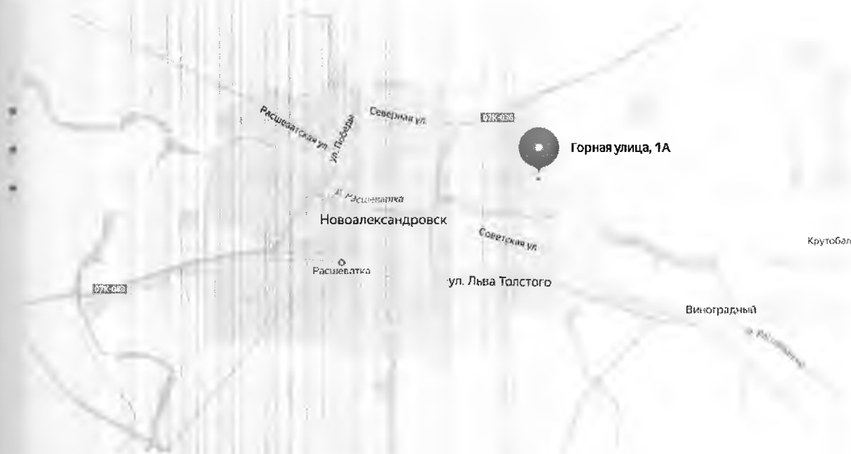
Рис.1 Местоположение объекта оценки