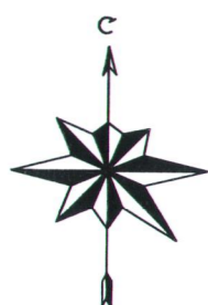
Схема планировочной организации земельного участка. М 1:500